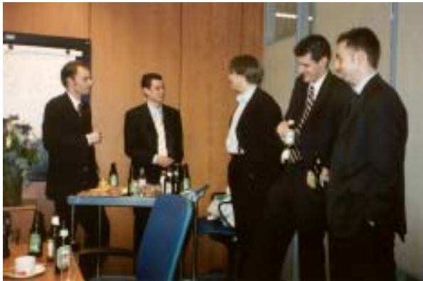
Borrel bij een van de accountants

Van 10 tot en met 20 februari heeft de FSA voor het achtste opeenvolgende jaar de Accountancy Week georganiseerd. Accountancy studenten maakten net als voorgaande jaren gretig gebruik van de kans om zich te oriënteren op de arbeidsmarkt. Er werden 6 vooraanstaande accountantskantoren bezocht alsmede de belastingdienst. De studenten kregen doormiddel van presentaties, rondleidingen en workshops de kans om kennis te maken met de verschillende accountantskantoren.