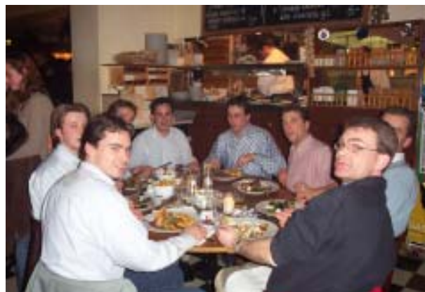
Diner met oud FSA Voorzitters, februari 2003

De laatste onzekerheid waar wij als bestuur mee te maken krijgen is het nieuw te vormen bestuur. Vanaf 1 maart is het mogelijk je kandidaat te stellen voor een bestuursfunctie in het studiejaar 2003/2004 van de grootste financiële studievereniging van Nederland, de FSA!! Op pagina 14 en 15 van deze Beyond kun je alvast meer lezen over een bestuursfunctie bij de FSA. Het bestuur 2002/2003 durft in ieder geval met zekerheid te stellen dat je er geen spijt van zult krijgen.