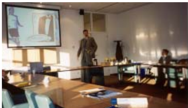
Presentatie bij de Belastingdienst

De eerste week werd afgesloten met een bezoek aan Ernst & Young. We werden ontvangen met een lunch en daarna kregen we een presentatie van een recruiter en een partner. Daarna hebben we een uurtje gelachen met de huiskomiek van Ernst & Young, die een flinke dosis boekhoudhumor in de strijd gooide. Daarna was er een accountantsversie van kopspijkers, dit was een erg leuke manier om wat over het accountantsvak te leren. Daarna hebben we nog een case gedaan. De case leek erg eenvoudig maar uiteindelijk had geen enkel groepje het grootste probleem goed benadrukt. De dag werd afgesloten in een restaurant aan de Prinsengracht.