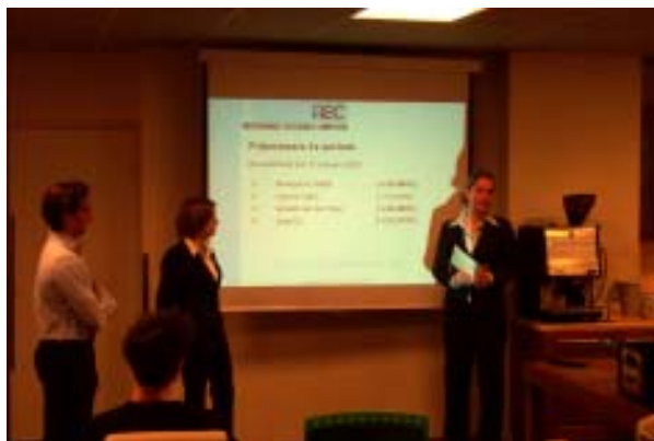
Huldiging van de winnaars van de eerste ronde van de ABC

De commissie van de Amsterdamse Beleggingscompetitie is continue bezig met de verbetering van de competitie. Er staan grote dingen te gebeuren in de nabije toekomst., kijk dus regelmatig op: http://abc.fsa.nl voor alle actuele informatie. Suggesties, vragen en opmerkingen zijn ook altijd welkom op abc@fsa.nl .