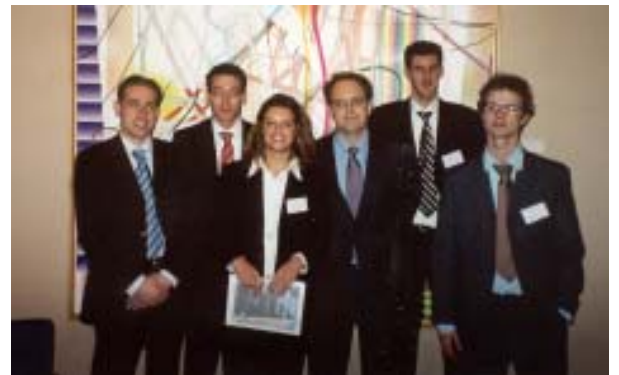
De AccountancyWeek commissie met medewerkers van Ernst & Young

De derde dag hebben we het kantoor van PricewaterhouseCoopers bezocht. Na de lunch en een korte presentatie begonnen we in groepjes van vier aan een case te werken. Het was een zeer uitgebreide case waarbij we gebruik maakten van toepassingen die accountants bij PwC in de praktijk ook gebruiken. Zoals laptops en Lotus Notes. De case ging uiteraard over een bedrijf waarmee van alles mis is. We moesten twee interviews voorbereiden en daarna onze bevindingen presenteren aan de andere deelnemers. De dag werd afgesloten met een diner in cafe de Omval. Een aantal PwC medewerkers was meegekomen zodat we goed in de gelegenheid waren om vragen te stellen.