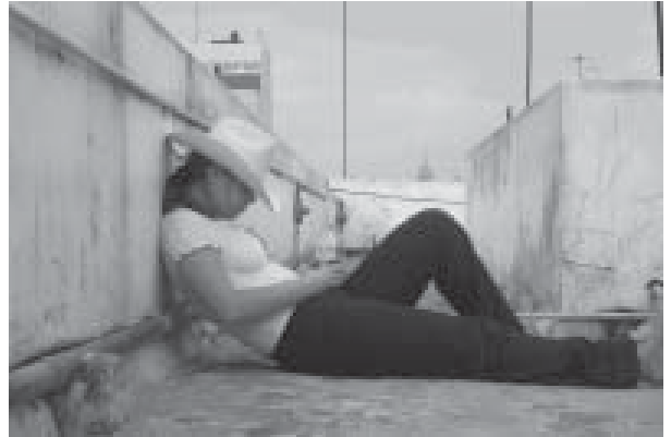
Het leven in Mexico is zwaar vermoeiend

Pemex levert ongeveer 40% van de overheidsinkomsten en is daarmee het belangrijkste bedrijf