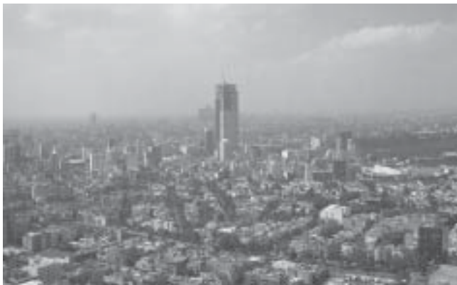
Uitzicht van een CEO

Met alle (nog niet uitgewerkte) interviews zijn we nu terug in Nederland. Na eerst even te zijn bijgekomen van alle waanzinnige ervaringen uit Mexico zijn we nu druk aan de slag met ons onderzoek wat tevens ons doctoraal werkstuk wordt. Met heel veel plezier hebben we deelgenomen aan het Research Project Mexico. Behalve dit onderzoek hebben we ook de Mexicaanse club-scene onderzocht en de culturele uitstapjes ontbraken er ook niet aan!