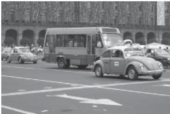
alleen maar van dit soort taxi's zie je daar