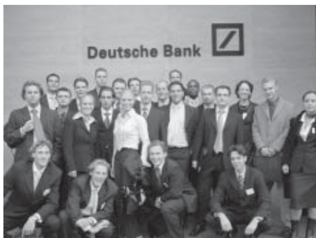
Groepsfoto bij DB

Maandag begon het echte werk, het eerste kantoor dat werd bezocht was Morgan Stanley. Aangezien deze bank niet in de City is gelegen maar in de buitenwijk Canary Wharf, mocht iedereen om 6.30 uur zijn bed uit om op tijd te komen. Zowaar kwamen we tien minuten te vroeg... Morgan Stanley had een goede presentatie en een leuke casestudy over de IPO van Burberry, waar we helaas wat weinig tijd voor hadden omdat we naar de volgende bank moesten. 's Middags vervolgden we ons programma bij Deutsche Bank, waar we begonnen met een lunch en gesprekken met startende analisten (is altijd handig met je mond vol). Daarna nog een presentatie en een graduate panel met als hoogtepunt: een rondleiding over de grootste trading floor van Europa.