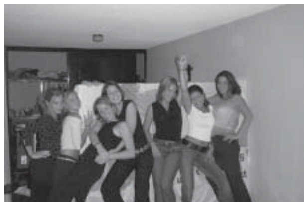
Mooi hè, die FSA flag op de achtergrond

Uiteindelijk heeft iedereen het ontzettend naar zijn zin gehad en zijn de meesten nu nog hard bezig met het verwerken van de data die in Mexico verkregen zijn. Door de combinatie van werk en plezier en het inzicht in de Mexicaanse manier van leven dat we kregen door onze gastvrije Mexicaanse vrienden is dit een zeer geslaagd project geweest en voor de meesten een reden om nog eens terug te keren naar Mexico, hetzij voor studie hetzij voor werk.