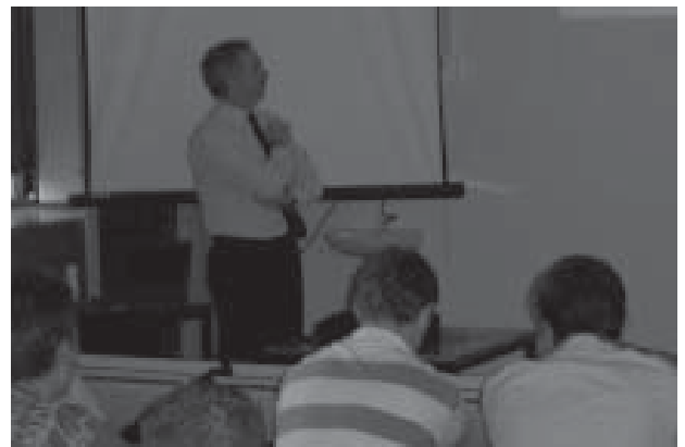
Uitleg van de portefeuille verdeling

In november zal de volgende inhoudelijke dag plaatsvinden. Neem tot die tijd zeker af en toe een kijkje op abc.fsa.nl voor alle actuele informatie.