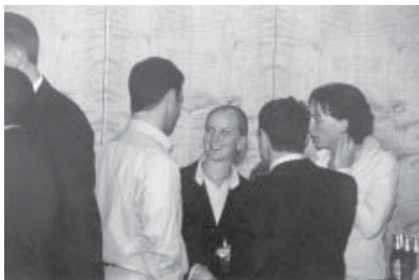
Borrelen bij JPMorgan

Dinsdagochtend werden we verwacht bij UBS Warburg. Precies op tijd aangekomen werden we gebeld dat we naar een ander gebouw moesten, met als gevolg dat we een half uur te laat waren... Verder wel zeer interessante presentaties, met als hoogtepunt: rondleiding over de grootste trading floor van Europa (alweer). De middag ging verder bij JPMorgan. Na de presentatie werden we in groepjes aan het werk gezet met een M&A case. Na al die inspanningen werd de dag beëindigd met een welverdiende uitgebreide borrel.