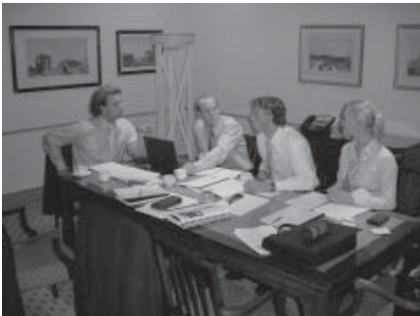
Werken aan dé case

Donderdag deden de metro's het weer, gelukkig, want we moesten naar Canary Wharf, Credit Suisse First Boston. Ook hier presentaties, met name over fixed income en equities, aangename afwisseling na vooral veel M&A. Daarna een soort trading/ sales game, met als afsluiting lunch. Voor het volgende bezoek mochten we weer terug naar de City, Goldman Sachs was aan de beurt. Hier kregen we een M&A deal uitgebreid belicht en een presentatie over de research afdeling real estate. En ook hier: rondleiding over de grootste trading floor van Europa (hoe doen ze het toch...). Als afsluiting kregen we een paar hartige hapjes en een blikje frisdrank, dus echt lang geborreld hebben we niet. Desondanks was het wel een interessante dag.