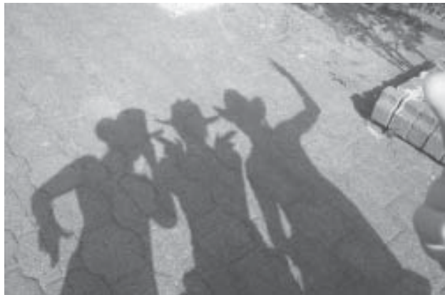
Sneller dan hun eigen schaduw!