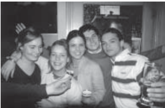
De commissie wederom.