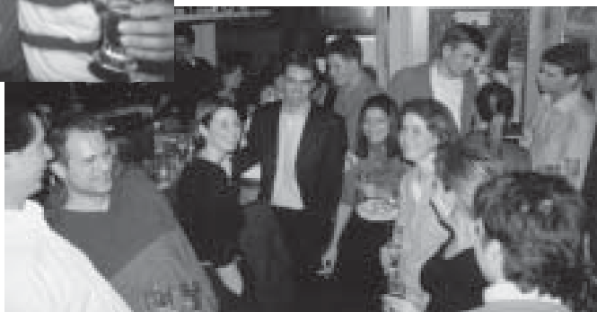
De borrel in restaurant 'Vamos a Ver'.