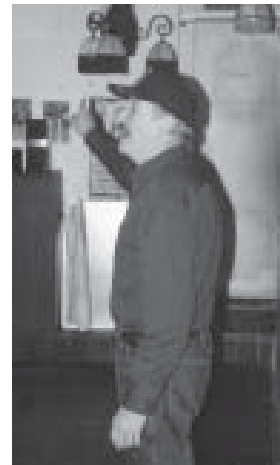
Onze salsa docent.