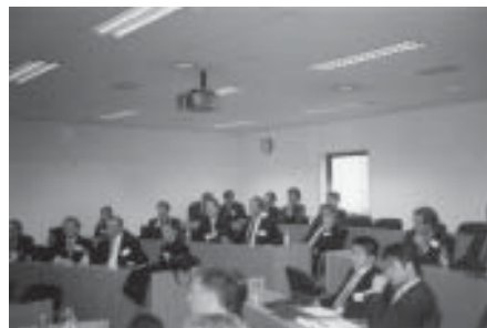
...een zeer leerzame en uitdagende workshop