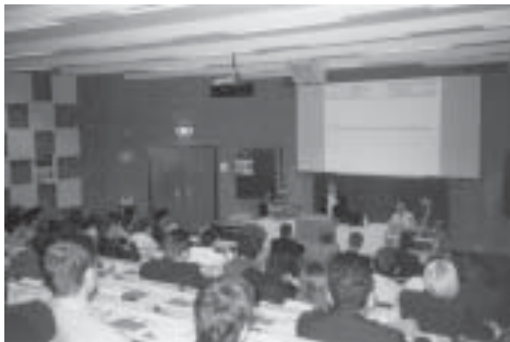
Een interessante presentatie en...